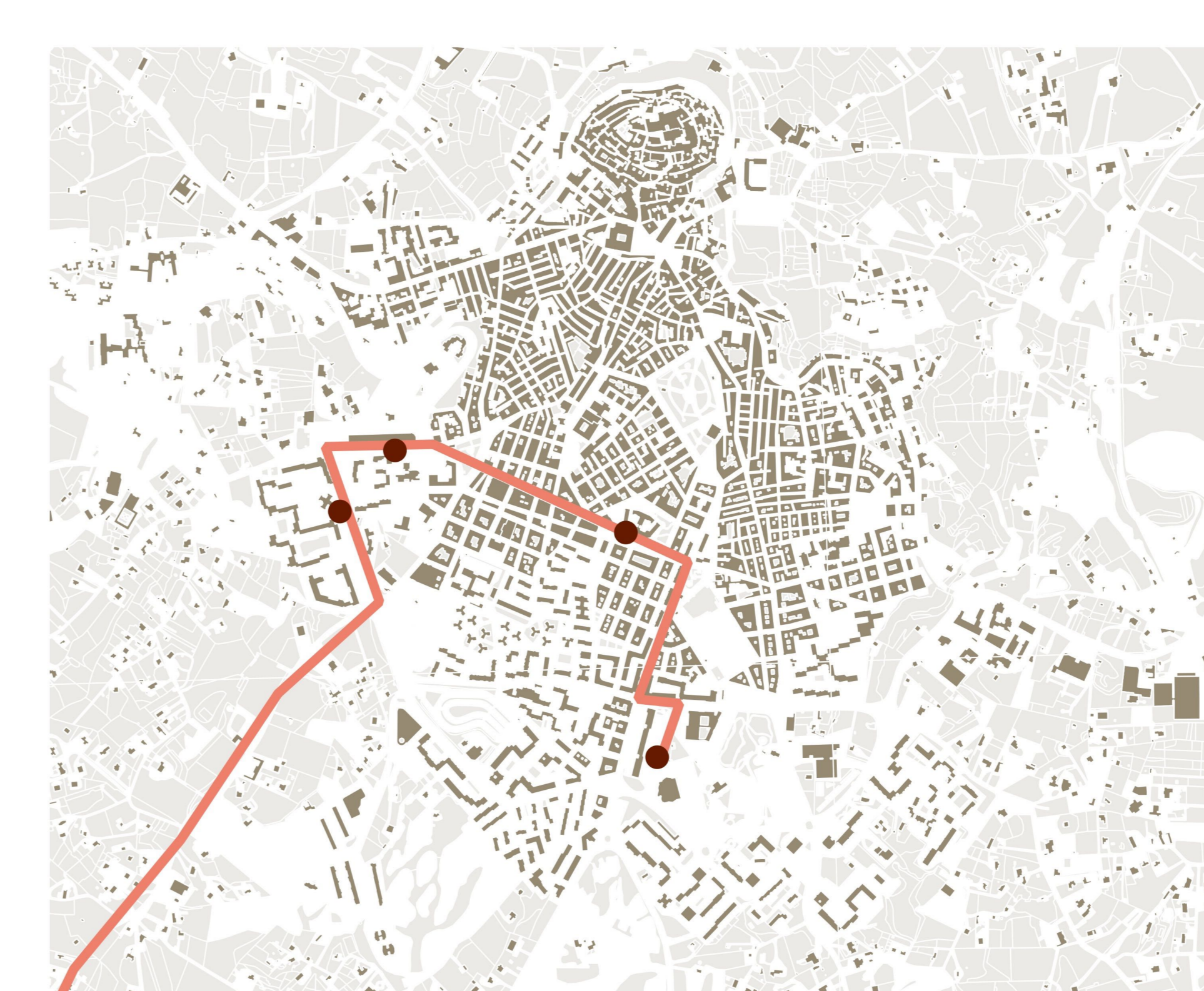
STP_ OSTUNI - MARTINA FRANCA