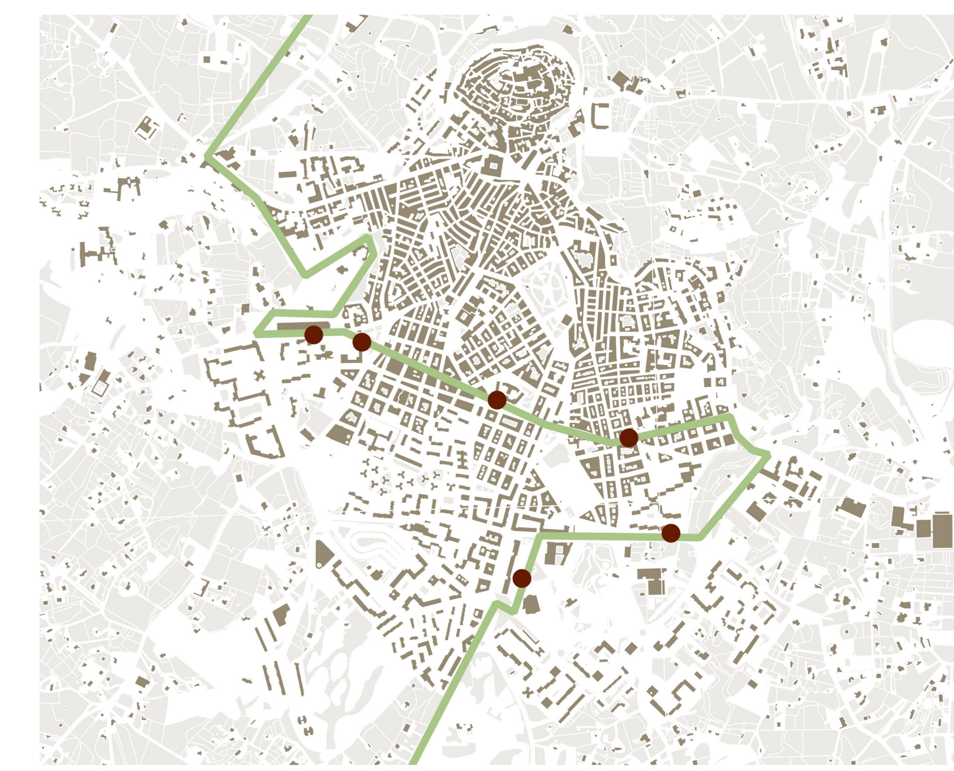
STP_CEGLIE - OSTUNI - VILLANOVA - TORRECANNE