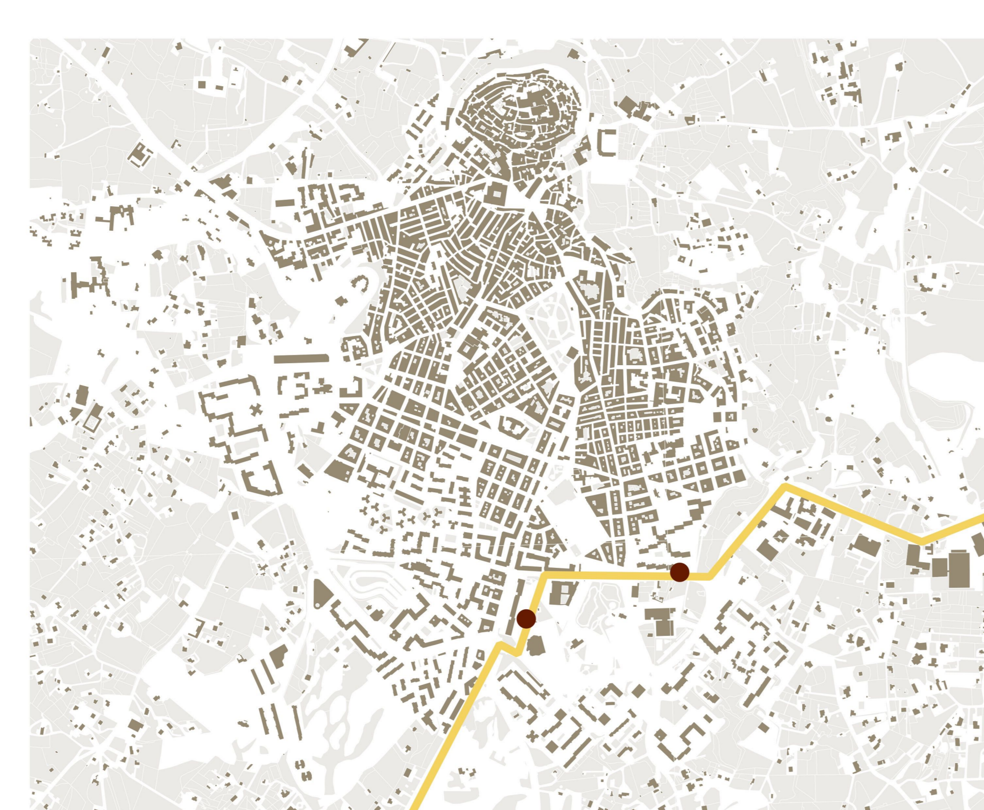
STP_CEGLIE - OSTUNI - CAROVIGNO - S. VITO - BRINDISI VIA N. BRANDI - BRINDISI STAB. LEONARDO

ELAB./TAV. TAV A5.1 Analisi dell'offerta REDAZIONE Agosto 2020 ADOZIONE APPROVAZIONE