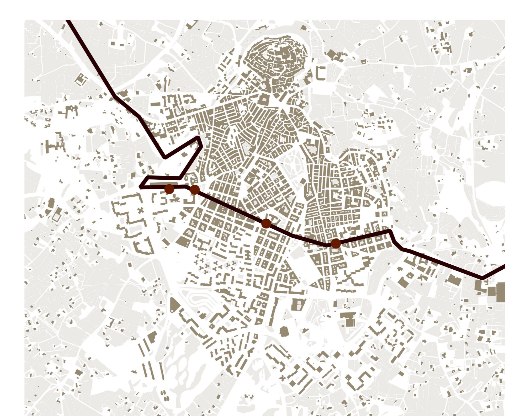
STP_FASANO - PEZZE DI GRECO - SPEZIALE - MONTALBANO - OSTUNI con coincidenza e prolungamento da OSTUNI per CAROVIGNO - S.VITO - BRINDISI + ZONA INDUSTRIALE