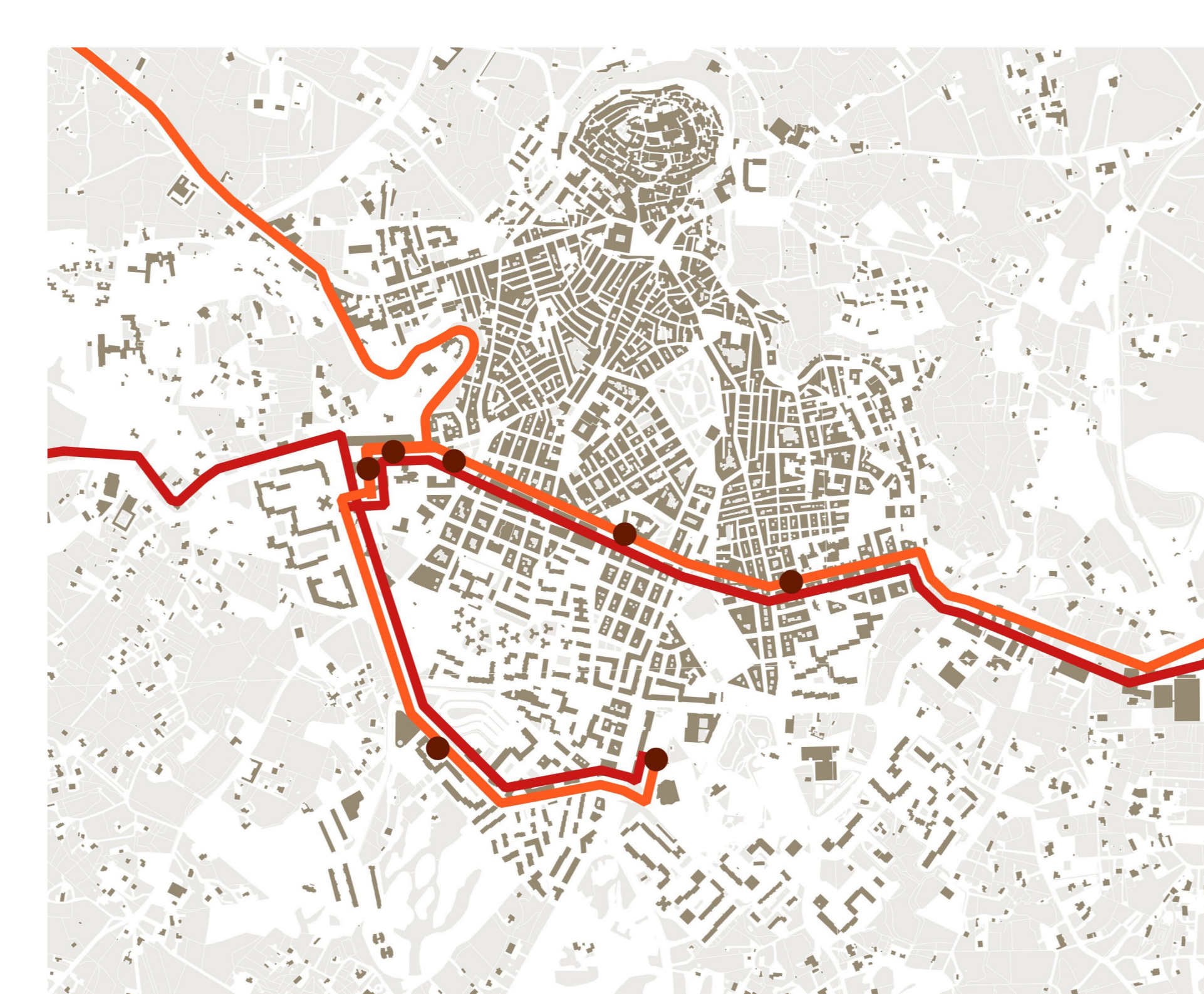
STP_CISTERNINO - (Speziale - Montalbano) - OSTUNI - CAROVIGNO - S. VITO (Latiano - Mesagne - Cittadella) - BRINDISI + Z.I. STP_CISTERNINO - OSTUNI - CAROVIGNO - S. VITO - BRINDISI con LECCE ecotekne