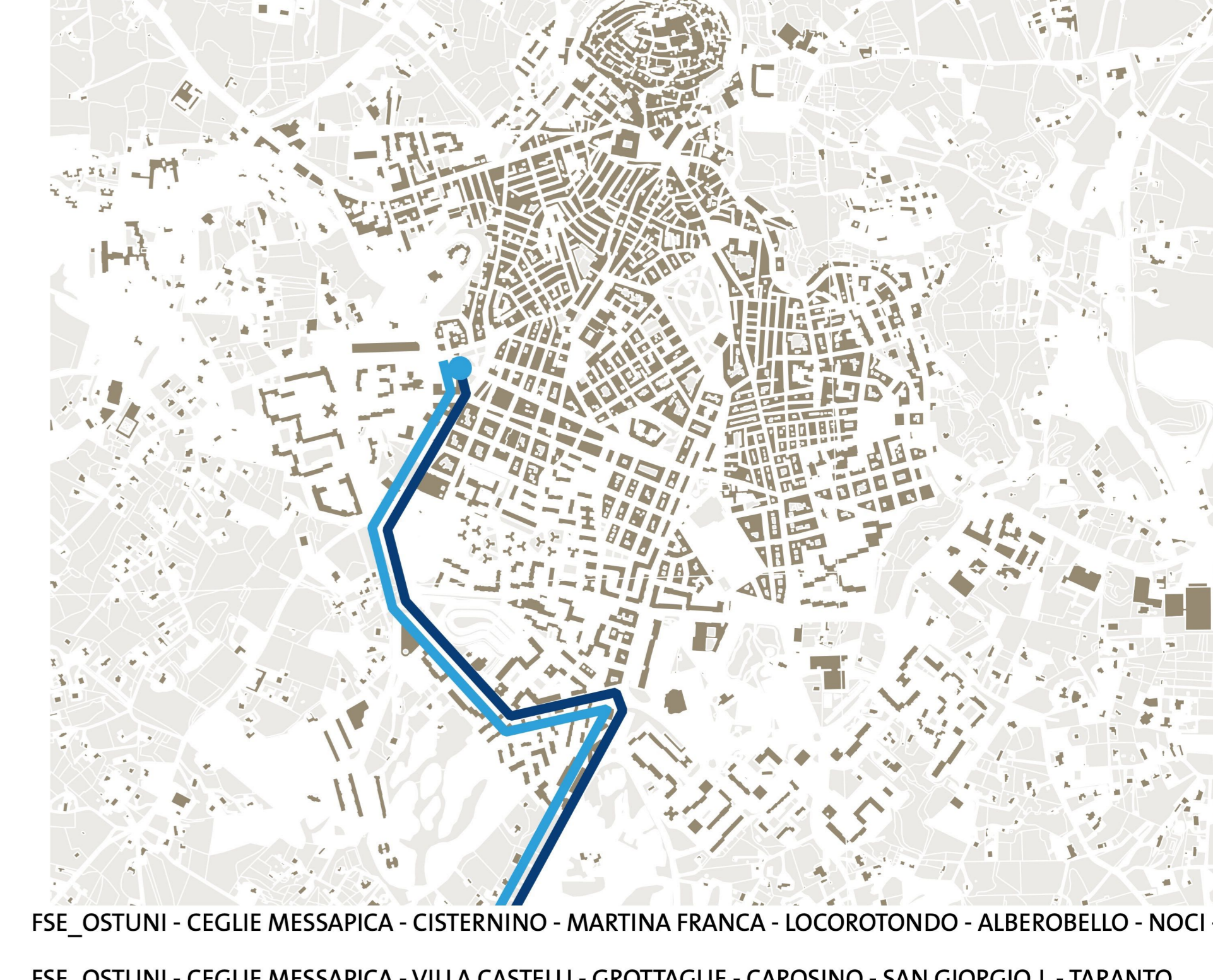
FSE_ OSTUNI - CEGLIE MESSAPICA - CISTERNINO - MARTINA FRANCA - LOCOROTONDO - ALBEROBELLO - NOCI - PUTIGNANO FSE_ OSTUNI - CEGLIE MESSAPICA - VILLA CASTELLI - GROTTAGLIE - CAROSINO - SAN GIORGIO J. - TARANTO