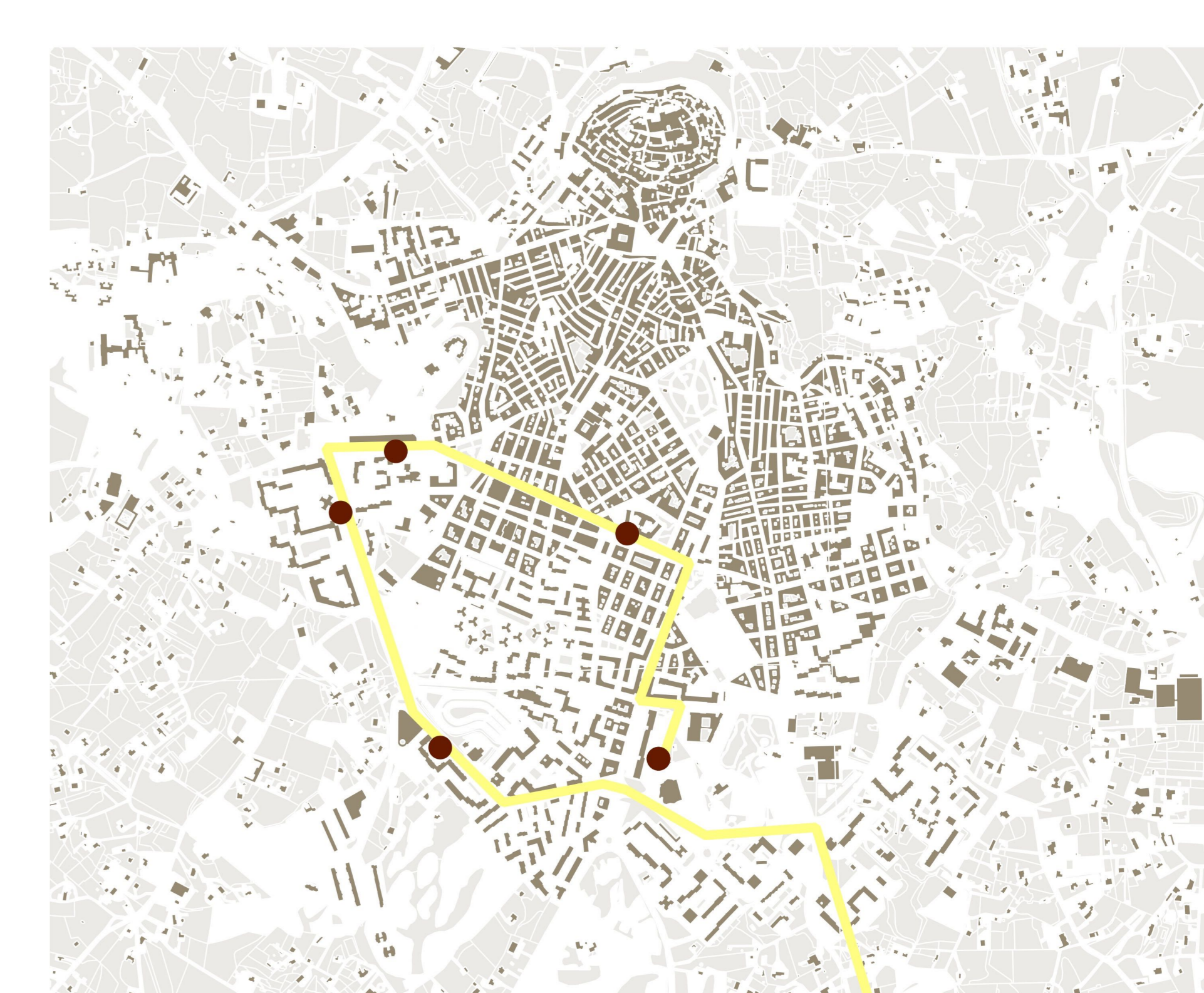
STP_ OSTUNI - SAN MICHELE SALENTINO